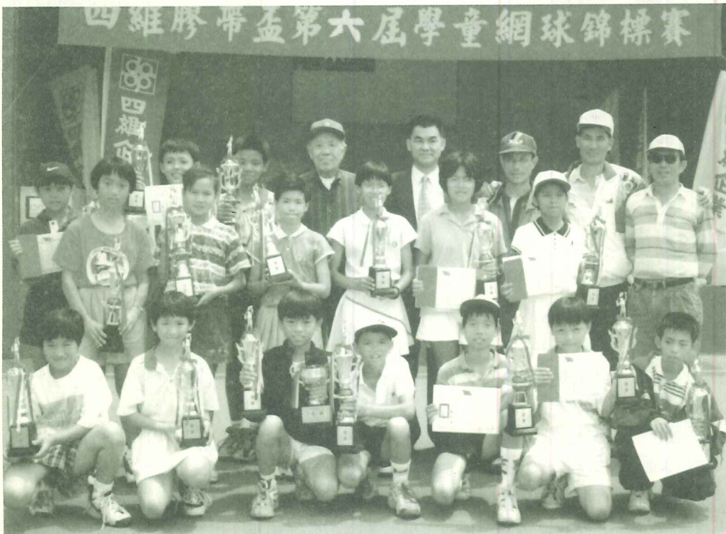
淡水青少年網球選手表現傑出，屢為淡水爭光。

淡十七日行災後形，由霧社、行瞭解仁份村落她們說落現在的房子居住地法開啓在基或坡屋向下償或是或是不從缺乏，和是碰於這回答富，學上美「好人？表達家才麼是受，鳴，