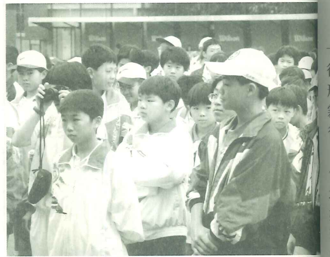
淡水青少年網球小將們到各地參賽，全力以赴、過關斬將，精神可加佳。

如果各位鄉親朋友有興趣的話，不妨也來看看這群練球的孩子吧！在球場裡磨練球技不僅僅讓小朋友們得以練出強健的身體，更重要的是，帶領他們的師長也注重孩子的身教與課業，因此，這群長年馳騁於球場的小將們不僅練就一身高強的球技，更培養出自重、自律的精神，不僅功課不落人後，在品行上更是不用父母操心，他們在球隊中所培養彼此良性競爭也相互砥礪的團隊精神，更是他們日後為人處世上的合群根基。