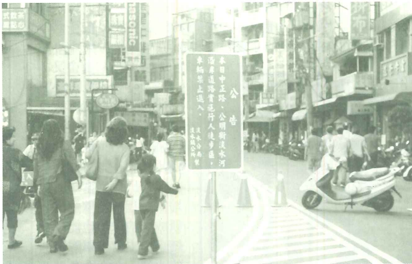
如何提升人行徒步品質將是未來規劃老街思考的重要方向。

此次「淡水老街假日行人徒步區」管制之範圍，包括中正路捷運站起至馬偕雕像、三角公園處，以及公明街、淡水河沿岸道路等；管制時間從當日上午九點至晚間八點進行，在每個出入中正路的路口均分派數名警力協助，禁止汽機車駛入；而住在老街的居民及做生意的店家車輛則需出示證明才能進出。但由於宣導及細節問題規劃未臻完整，實施的第一週部份居民便反映感到不便，也間接影響周邊的交通；而第二週實施時，因天氣晴朗，更引得眾多人群湧入老街，所幸早已調配大批警力，從早上九點起在淡水各交通要道處進行疏導，使得周邊道路及老街